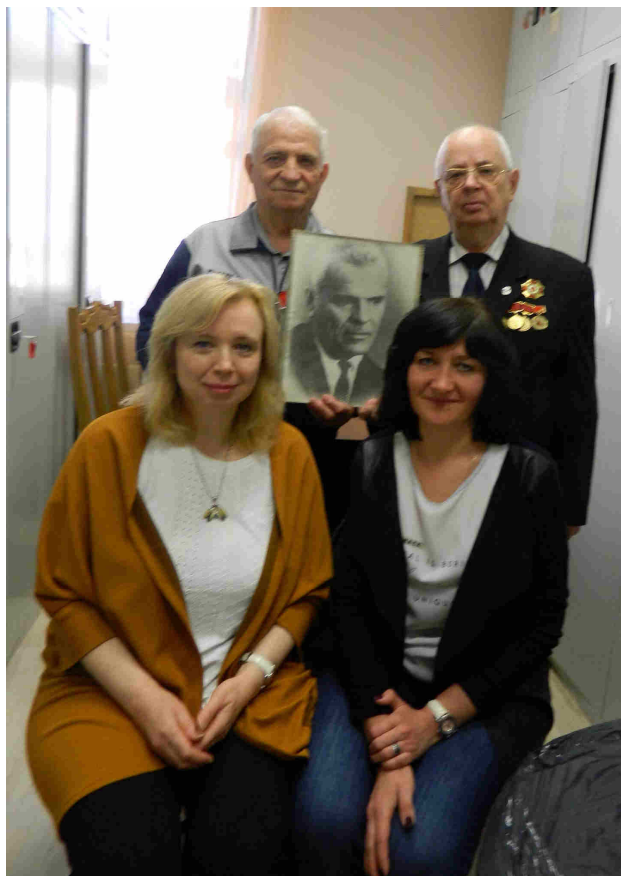
Калабалинцы с музейными работниками архива 14.05 2021 г.