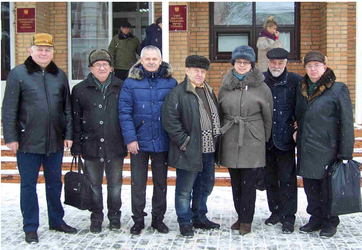
Калабалинцы – инициаторы создания Фонда