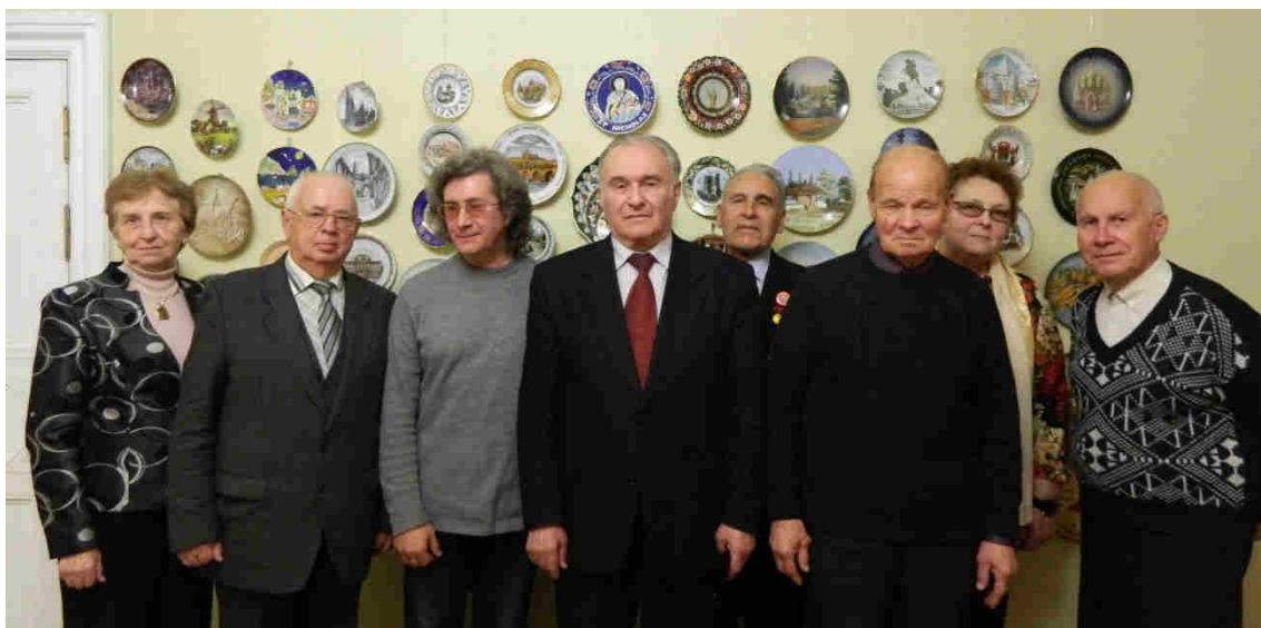
В заключение встречи была сделана традиционная общая фотография и состоялось дружеское чаепитие.